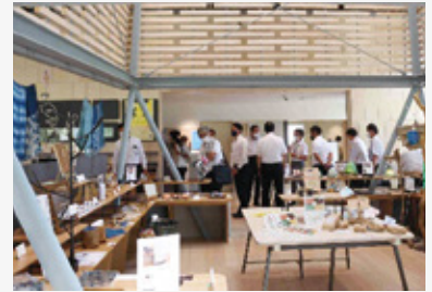
「せきてらす」内の観光案内所を視察

「岐阜市役所」新庁舎の概要及び運用面の工夫、地域内の産業・観光発展や市民交流などを目的とする施設を集積した「せきてらす」の取組み、県道松原芋島線の「川島大橋」の緊急対策工事の状況について調査を行いました。