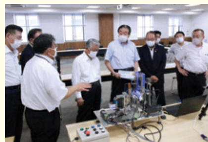
岐阜県産業技術総合センターを視察

モノづくりに取り組む企業、教育研究拠点、試験研究機関を視察し、県内産業の生産性向上と高付加価値に関する調査に加え、多様な人材の活躍に関する調査を行いました。