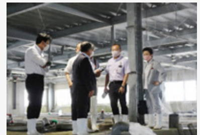
(一財)岐阜県魚苗センターを視察

2015年に世界農業遺産に認定された「清流長良川の鮎」の保護や飼育に係る中核施設、昨年オープンした森林教育や木育の拠点施設、農業技術に関する研究施設において、それぞれの取組状況を調査しました。