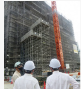
建設中の柳ヶ瀬グラスル35を視察

緊急対策工事を実施している川島大橋や、県民の命を守る土砂・浸水対策事業、岐阜市の再開発事業などの現状と課題について調査しました。