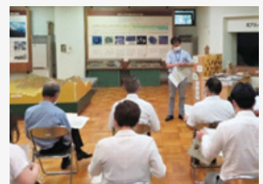
飛騨・北アルプス自然文化センターを視察

多世代交流拠点、食肉衛生検査体制、自然文化の情報発信拠点、鹿児島県との姉妹県盟約50周年記念特別展を調査したほか、高山市医師会等と新型コロナウイルス感染症対策について意見交換を行いました。