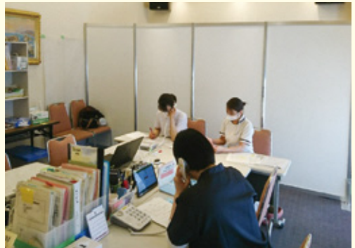
療養者の健康状態を聞き取る看護師(ホテルKOYO)

・感染後の後遺症については、根本的な治療方法が確立されておらず、現在は対症療法しかありません。引き続き、24時間365日、看護師が対応する県の新型コロナウイルス健康相談窓口で、後遺症に苦しむ方に寄り添った支援に努めていきます。