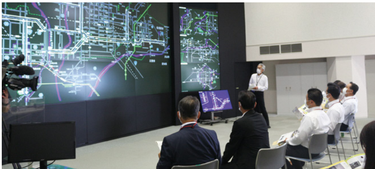
◀ 教育警察委員会視察(令和3年7月16日) 「交通管制センター」を視察」