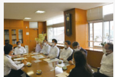
県立岐阜高等学校を視察

タブレット端末を活用した授業や、ICT機器を使用したコミュニケーション英語の授業を進める県立学校や、県民の安全・安心を守る警察所管施設の現状と課題について調査しました。