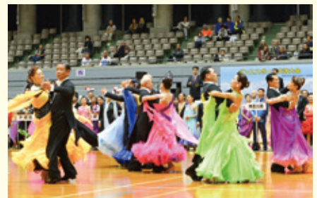
ダンス競技の様子：和歌山大会(令和元年)

・その他「清流の国ぎふ」の魅力を存分に満喫していただけるプログラムを準備していきます。