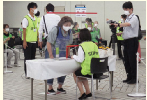
大規模接種会場でのリハーサル(岐阜産業会館)