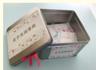
学校保健室で配布している生理用品

・今年度より新たに、県産婦人科医会と連携して、県立高校生を対象に実施します。 ・性に関わる課題について、正しい認識が深められるよう指導していきます。