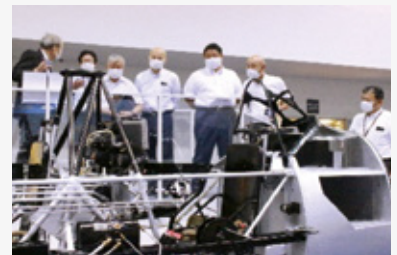
ヤマザキマザック工作機械博物館を視察

県有施設の運営状況のほか、工作機械の進化と仕組みの紹介を通じて、「ものづくり」への関心を高める取組みや、外国人共生に関する現状や取組み、陶磁器産業の振興・活性化について調査しました。