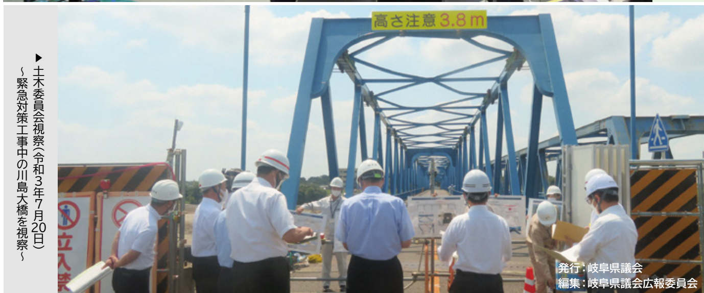
▶ 土木委員会視察(令和3年7月20日) 「緊急対策工事中の川島大橋を視察」