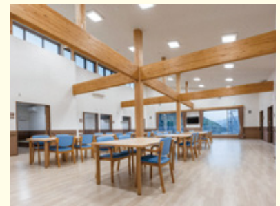
盲養護老人ホームの食堂

県内唯一のこの施設がより有効に活用されるよう、今後、措置を行う市町村や、障がい者支援団体との意見交換と情報共有を積極的に行い、施設の活用を促進していきます。