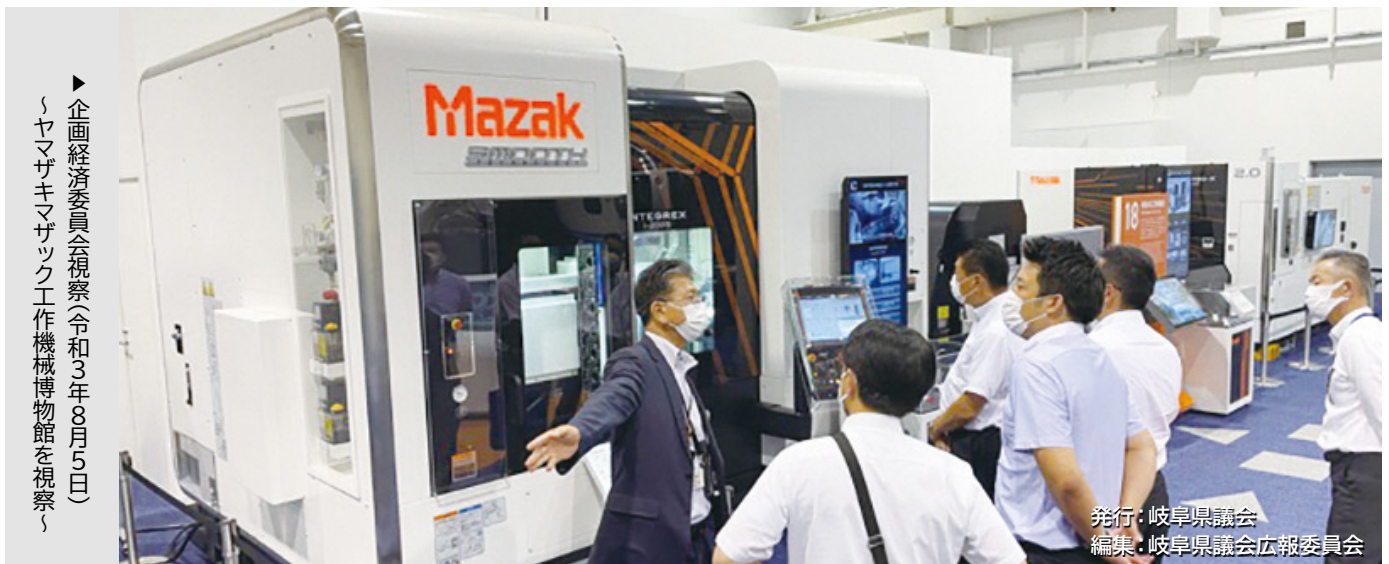
▶企画経済委員会視察(令和3年8月5日) 「ヤマザキマザック工作機械博物館」を視察」