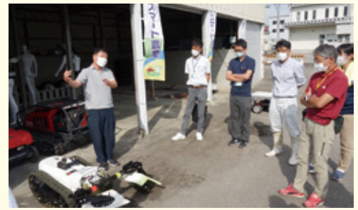
スマート農業技術の実演研修風景（中山間農業研究所）