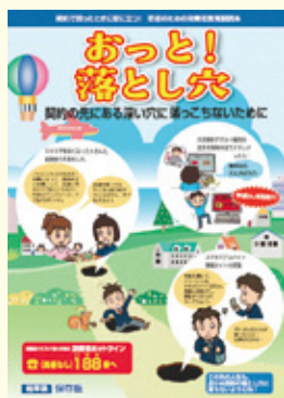
消費者教育副読本

答弁 県では、県教育委員会と連携し、県内の若年者に多いトラブル事例を盛り込んだ消費者教育副読本を作成し、県内の学校に配布するとともに、全ての高校において、授業等で活用することで、注意喚起を行っています。