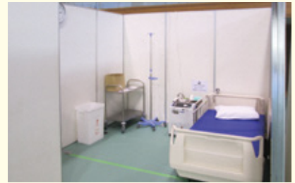
臨時医療施設の整備状況